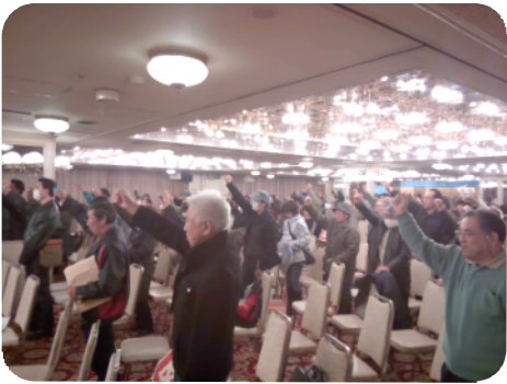
↑こぶしを突き上げ「団結頑張ろう!」 傘を差したデモ行進の長い列↓

重税反対全国統一行動の土崎・男鹿・南秋地区集会在午前、北部市民サービセンターで、午後に秋田県中央集会在大町ビルにて行われました。当日は朝から小雨が降り続き、肌寒い気温でしたが、秋田県中央集会是約300名、土崎・男鹿・南秋地区集会是約200名の参加者が集まりました。