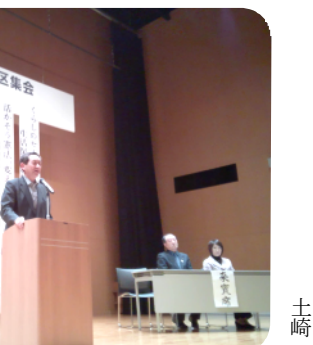
土崎・男鹿・南秋地区集会